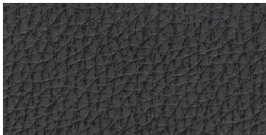
レザー: ブラック (LB)