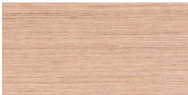
木目2: ブラウン (WB)

※上記の色見本は印刷の関係上、実物と多少異なることがあります。 サイズにより、表情が異なります。