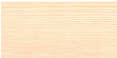
木目1: アッシュ (WA)