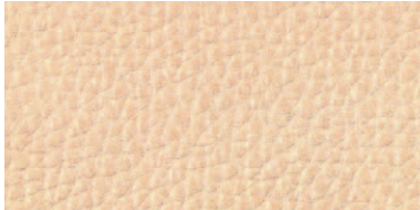
レザー: フレッシュ (LF)